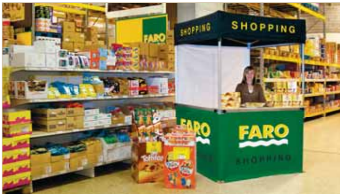
MASTERTENT® 1,5 x 1,5 m www.mastertent.com