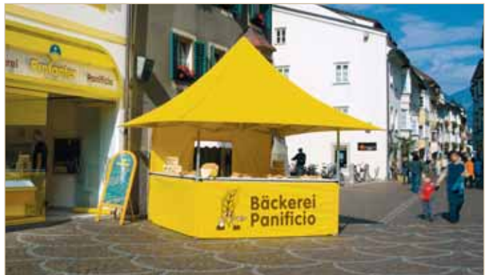
MASTERTENT® Shop www.mastertent.com