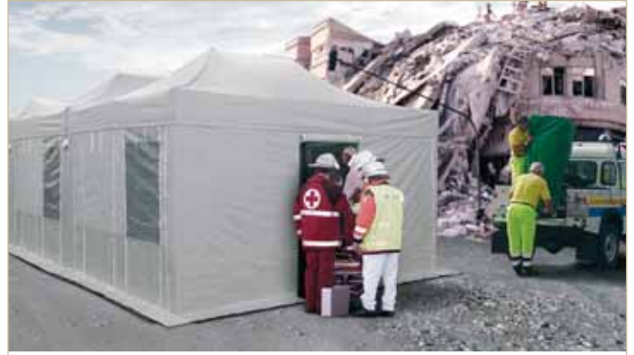
MASTERTENT® Rescue www.mastertent.com